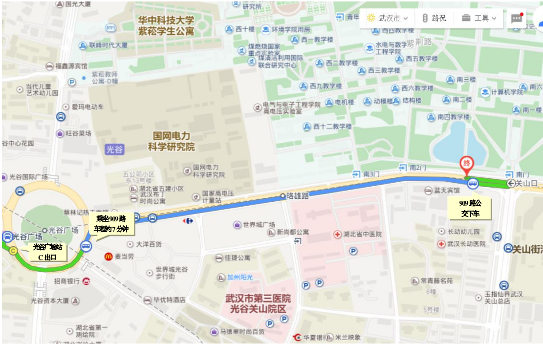
图 1：光谷广场到珞喻路关山口站